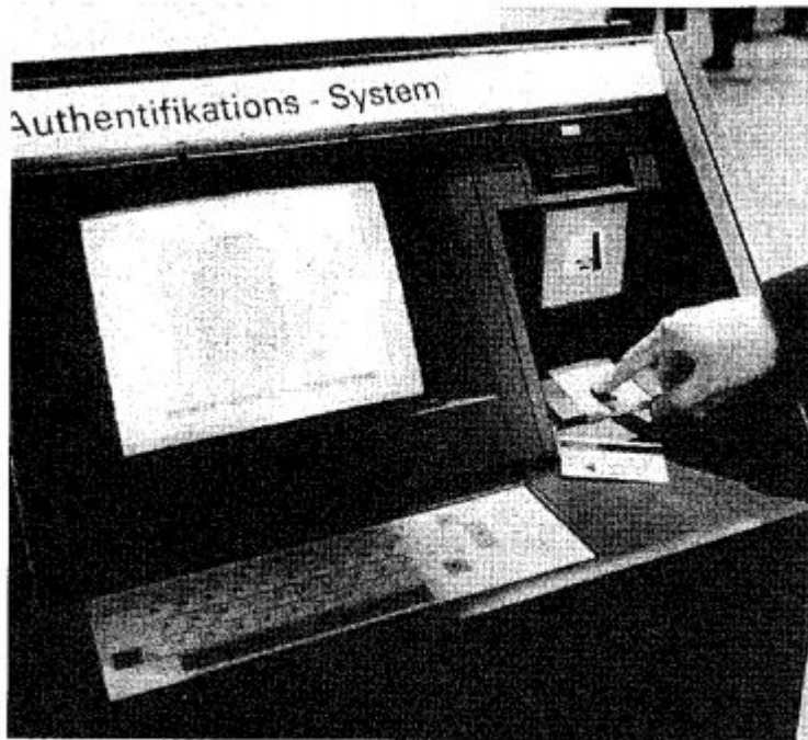
Abb. 1: Sichere Identifikation durch Fingerprint

Personen äußerst gering ist. Mit anderen Worten: Dieses Gerät ist vor allem für eine vollautomatisierte Personenkontrolle besonders gut geeignet!