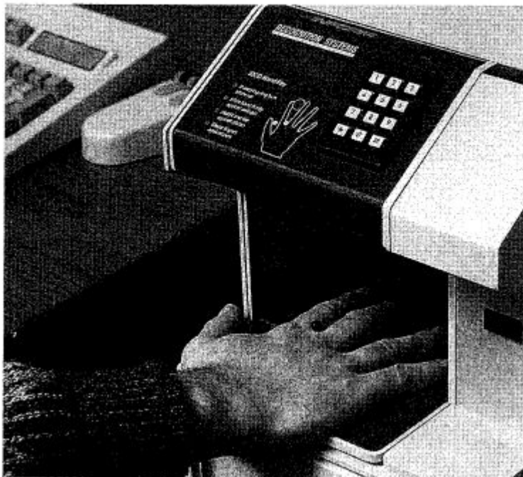
Abb. 2: Handgeometrie-Leser im praktischen Einsatz